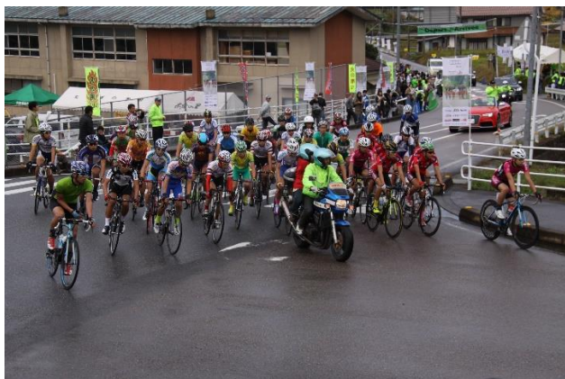
最初のコーナーを曲がり『大草の上り』へ