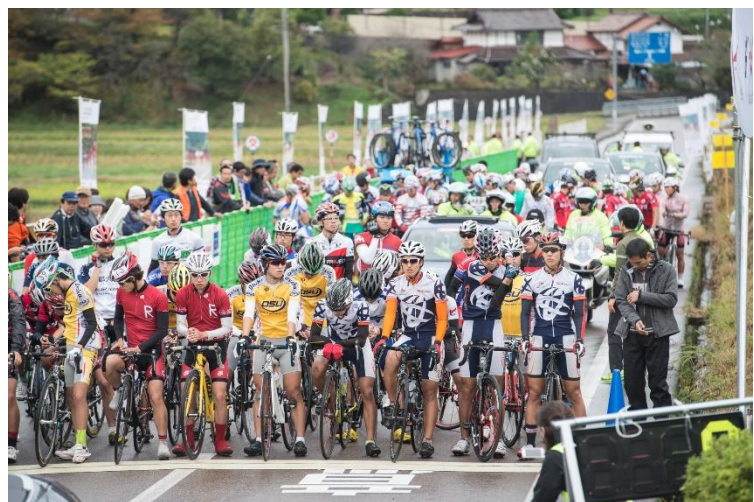
スタート・フィニッシュ地点