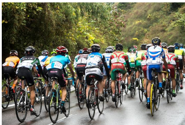
コースの最大の上り坂『大草の上り』へ 獲得標高 100m