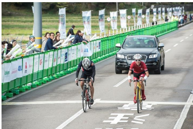
感動のフィニッシュ